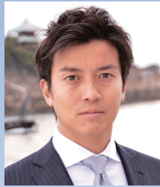
コーディネーター 小林 史明 （衆議院議員）

参加お申込みの際は、ご記入の上【Fax 084-926-9607（東林館高校）】までFAXもしくは、下記内容を記載し、【 hagukumi.children.kk@gmail.com 】までメールをお願いします。